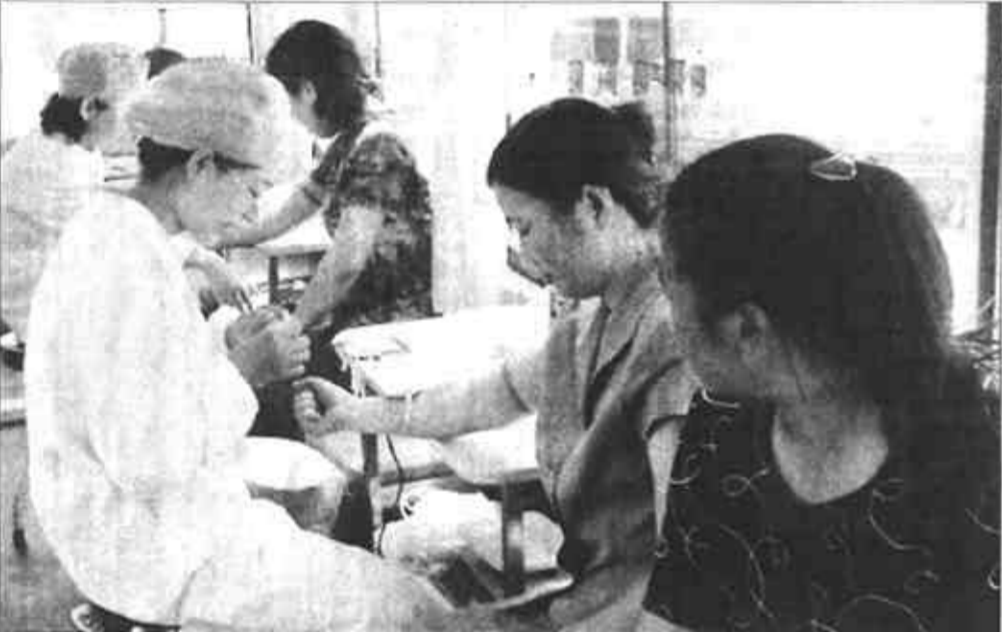
胜中社区热力中心老年工作站工作人员正在为老人们提供服务。

县法院团支部提出了学业务、强素质“读书活动”，并向全院团员青年发出倡议。要求团员青年减少各类不必要的应酬，每天保证不少于一个小时的学习时间。